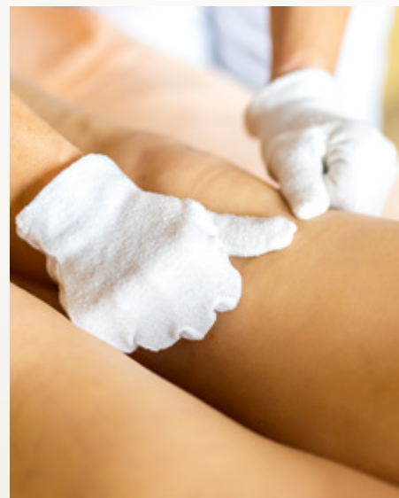
Manuálna lymfodrenáž končatín