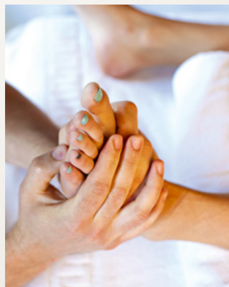
Reflexná masáž chodidiel s hrejivým zábalom