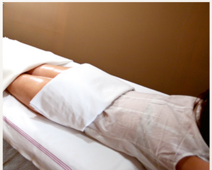
Grepovo-citrónový detoxikačný zábal