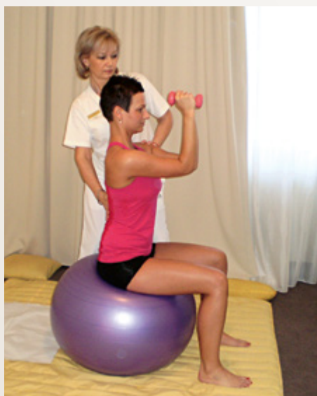
Individuálny liečebný telocvik

Akútne zápalové ochorenia, krvácavé a horúčkovité stavy.