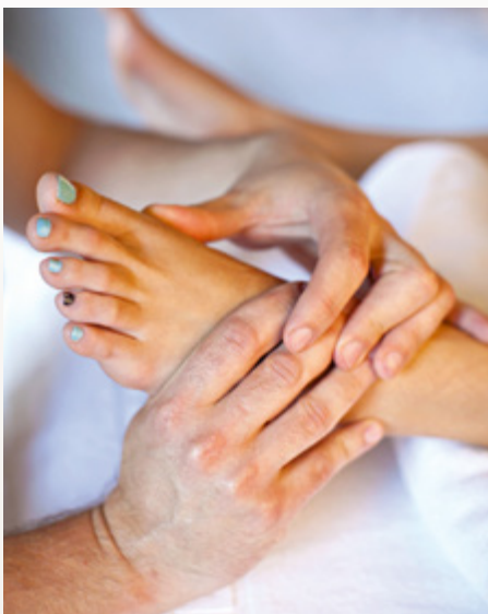
Reflexná masáž chodidiel

Sú rovnaké, ako pri reflexnej masáži nôh.