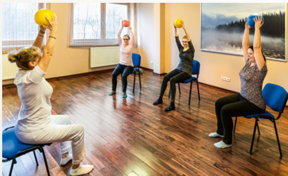
Skupinový liečebný telocvik